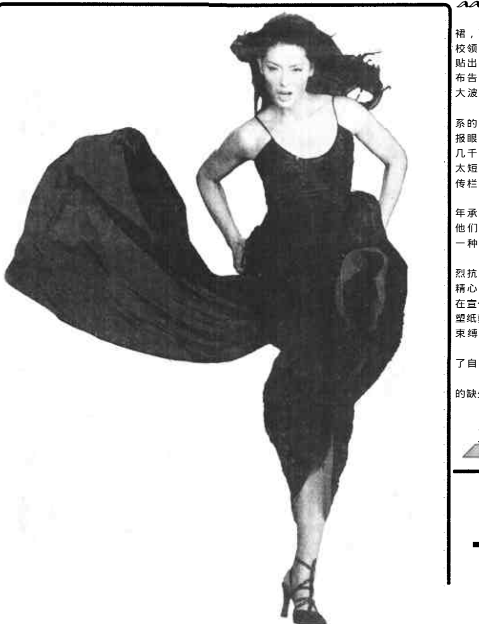
爱丁堡国际艺术节

息的，这些物质触发了好攻击的行为，顺次的第二个蛋也会得到同样剂量的物质。然而，第三个蛋却只能得到一半剂量。这样，雏鸟出生后，是得到物质最少的一只，完全没有能力抵抗比它生性好斗而且强壮的哥哥姐姐。